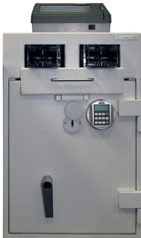
Der CashIn Mini: Sicher, kompakt und smart.

Mit dem Full-Service für unsere Gerätelösung unterstützen und entlasten wir Sie in allen operativen Belangen und liefern bundesweiten Service aus einer Hand.